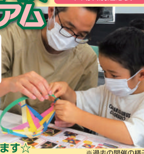
※過去の開催の様子

モノづくりの楽しさが体験できる 工作イベントです! 日にちによって 工作するものが変わります☆